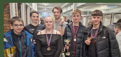
Quel plaisir de rapporter coupes et médailles à la maison!

Le BCKHM a participé à 3 compétitions de slalom durant ce dernier trimestre 2025 : le sélectif régional de Vaires-sur-Marne en octobre, sur le bassin olympique, celui de Torcy, et le slalom esquimautage de Cachan en Décembre.